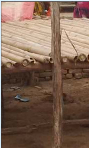
बाँस का फर्श