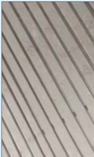
लकड़ी का फर्श