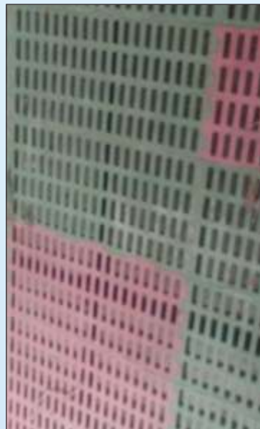
प्लास्टिक का फर्श